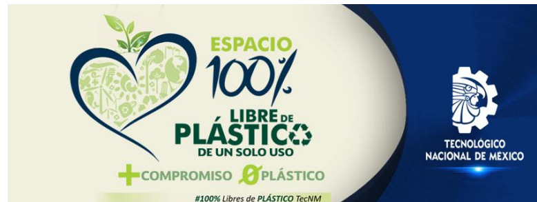
Figura 7. Campaña de Sensibilización del Programa 100% Libre de Plásticos de un solo uso en el Tecnológico Nacional de México/Instituto Tecnológico de Chihuahua II.

Como iniciativa de los docentes y estudiantes de la materia de desarrollo sustentable dieron a conocer algunas medidas del programa 100% Libre de Plástico a la comunidad tecnológica (Figura 8).