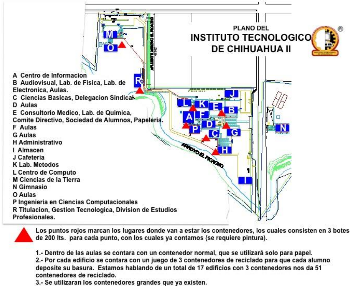
Figura 4. Plano con ubicación de las estaciones ecológicas en el Instituto Tecnológico de Chihuahua II.