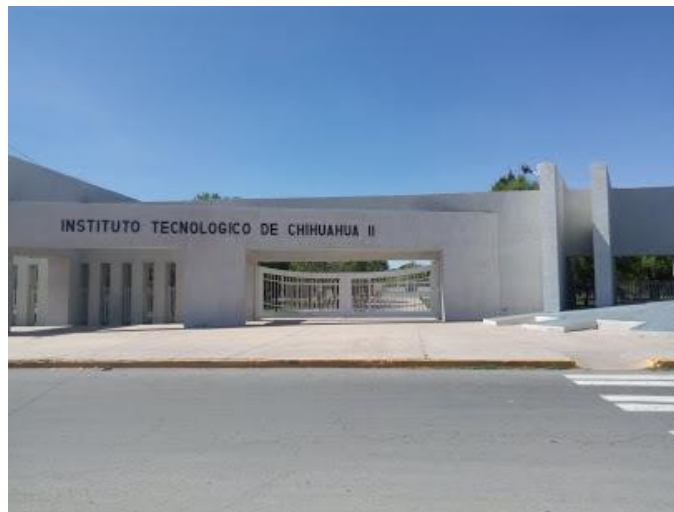
Figura 1. Fachada principal Instituto Tecnológico de Chihuahua II

El Instituto Tecnológico de Chihuahua II se fundó para satisfacer una necesidad social en el estado de Chihuahua; con el compromiso de las autoridades de resolver la creciente demanda de los jóvenes por ingresar a instituciones de educación superior, el 14 de septiembre de 1987 se aprobó su creación e inicio sus actividades. El Instituto es un campus del Tecnológico Nacional de México (TecNM), la institución más grande del país por su cobertura en las 32 entidades federativas.