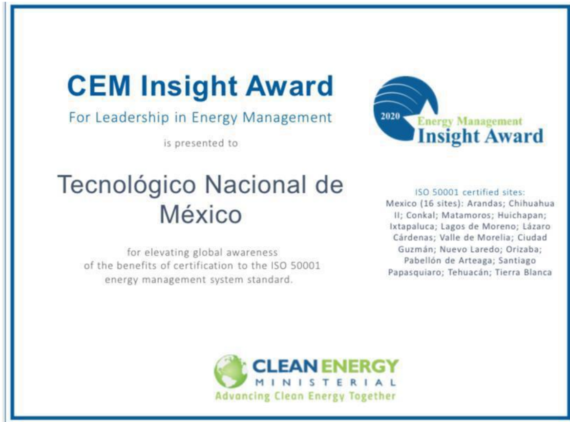
Figura 10. Reconocimiento al Tecnológico Nacional de México y 16 campus entre ellos campus Chihuahua II por su Sistema de Eficiencia Energética.