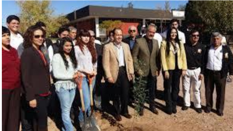
Figura 5. Entrega de 300 encinos en el marco de las XXIII Jornadas de Desarrollo Sustentable del Instituto Tecnológico de Chihuahua II en el programa de forestación y reforestación permanente que realiza la Secretaría de Desarrollo Urbano y Ecología (SEDUE) en el Estado de Chihuahua.