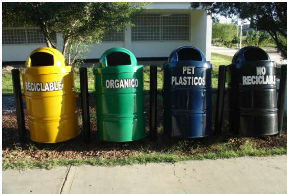
Figura 3. Estación ecológica del Instituto Tecnológico de Chihuahua II.